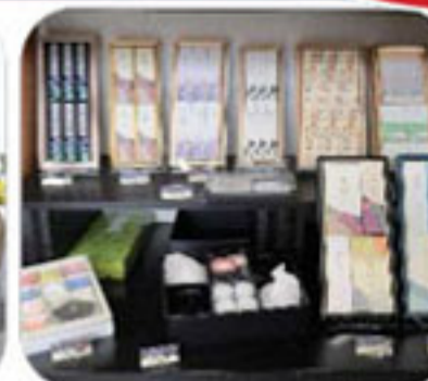
お線香・ご供養用品