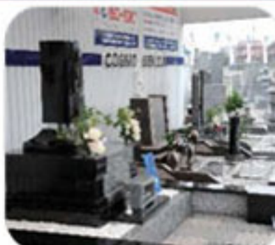
デザイン・和型墓石