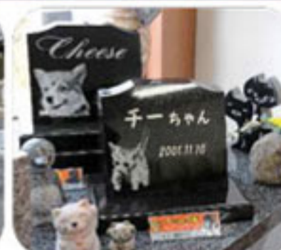
ペット彫刻・お墓