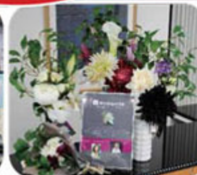
メモリアル・フラワー